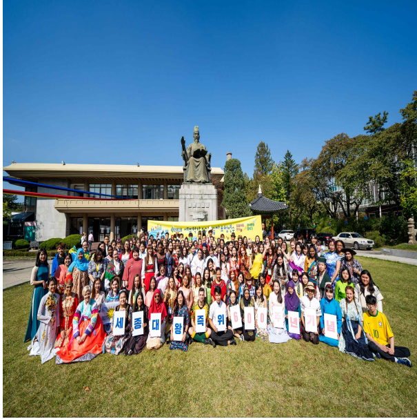
참가자 전체 사진 촬영