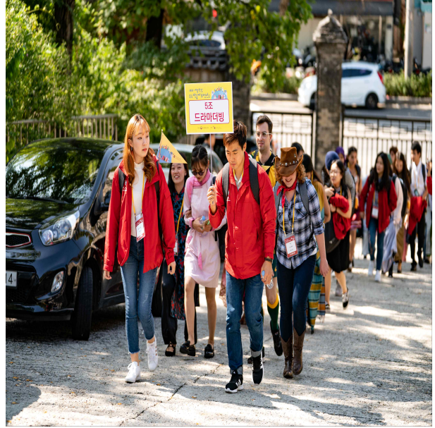
참가자 인솔 및 문화체험