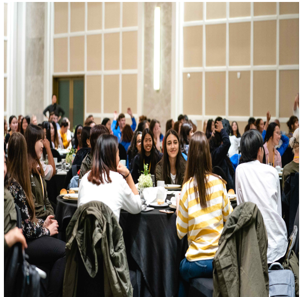
참가자 소통 및 문화교류